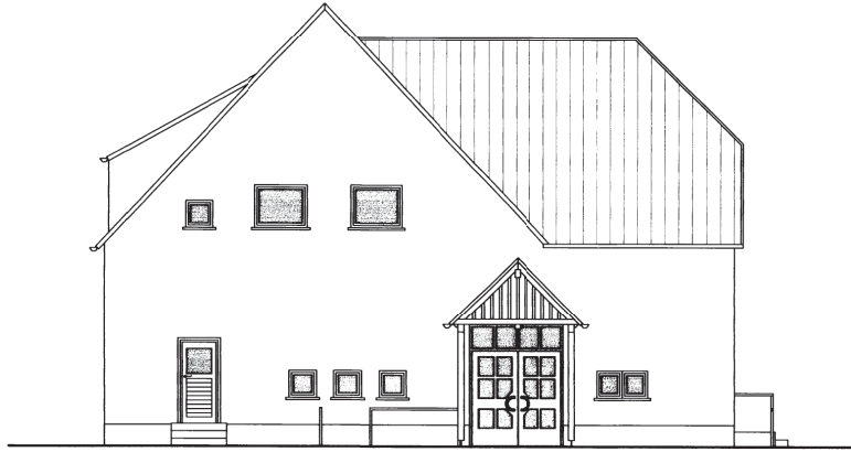
Nord - Ost Ansicht