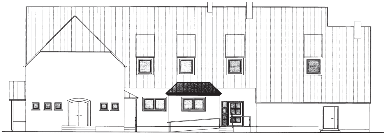
Nord - West Ansicht

Bauaufsichtlich geprüft Bauschritt 003 - 22 - 3 Datum 24. Juni 2011 Kreisvermessungsamt im Auftrag